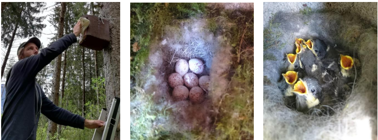
Abb. 5 bis 7: Kleiber Nistkästen bei der Kontrolle von außen, Kohlmeisengelege und bettelnde Tannenmeisen

Die wöchentliche Nistkastenkontrolle begann am 29.2.2020 und endet durch die Ausgangsbeschränkungen wegen der Corona Pandemie vorläufig zum 14.3.2020. Nach der Ausstellung einer Ausnahmegenehmigung zum Verlassen des Gemeindegebietes konnten die Kontrollen mit 4.4.2020 fortgesetzt werden. Das erste Ei der Brutsaison wurde am 31.3.2020 von einem Kleiber im Fichtenforst gelegt. Die Beringung erfolgte zwischen 1. Mai und 9. Juli. Es wurden insgesamt davon 165 Vögel beringt, davon 14 Altvögel und 151 Nestlinge von Kohlmeise, Blaumeise, Sumpfmeise, Tannenmeise und Kleiber.