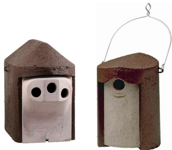
Abb. 2: Schwegler Holzbeton

Insgesamt haben 26 der verwendeten Nistkästen ein Einflugloch mit einem Durchmesser von 28mm, 14 einen Durchmesser von 32mm, 8 einen Durchmesser von 30 x 45mm und 5 haben jeweils drei Löcher mit einem Durchmesser von 27mm. Zusätzlich wurden noch 10 Nistkästen für Wiedehopfe ausgebracht. Diese wurden jedoch noch nicht angenommen und werden daher in diesem Bericht nicht weiter behandelt. 25 der oben beschriebenen Nistkästen wurden in einem naturnahen Auwald ausgebracht und die anderen 25 in einem bewirtschafteten Fichtenforst.