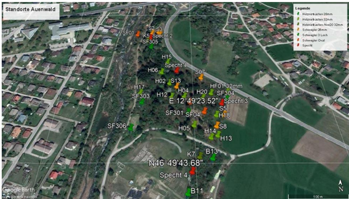
Abb. 3: Verteilung der Nistkästen im Auwald